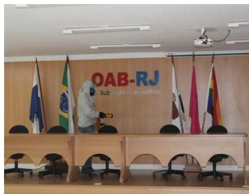
Sanitização na Sede

No dia 2 de Outubro, foi realizada a SANITIZAÇÃO das instalações da sede da OAB/RJ Leopoldina, e na sala da OAB/RJ Leopoldina no Fórum, localizada no 6º andar. Foi promovida a desinfecção e limpeza profunda de ambientes, que é executada através da aplicação de um produto sem cheiro ou contra-indicações, este produto é aplicado através de um termonebulizador, que despeja no ar do ambiente minúsculas gotículas que alcançam todo o ambiente e protegem por mais tempo.