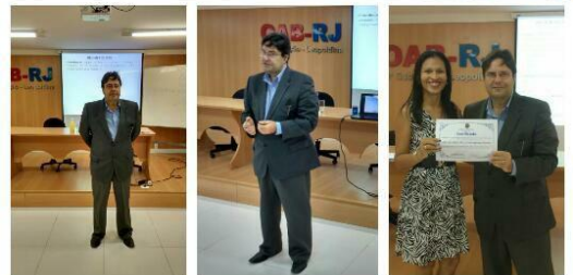
Cápsulas do Direito – Direito de Família