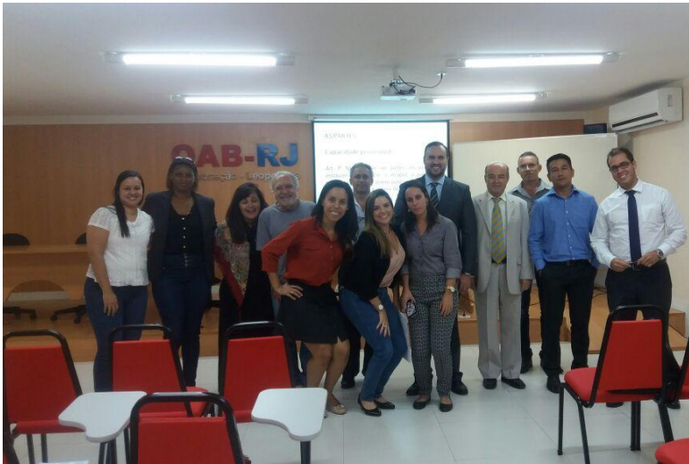
Cápsulas do Direito – Juizado Especial Cível

No mês de abril, a ESA Leopoldina realizou três edições do projeto “Cápsulas do Direito”, tratando de conteúdos jurídicos diversos: Direito de Família, Direito Processual e Direito Imobiliário. O objetivo do projeto é proporcionar cursos com carga horária mínima, tratando de institutos jurídicos específicos, atendendo a demanda de cursos rápidos e de baixo custo, de modo que o advogado possa investir em sua capacitação de como econômico e ajustado ao pouco tempo disponível em sua rotina. As “Cápsulas do Direito” estão programadas para todos os meses, com temas dos mais variados, de modo que o advogado e a advogada possa atender a sua constante necessidade de atualização. Acompanhe nossos informativos e o facebook da OAB Leopoldina e inscreva-se pelo telefone 3976-5599 .