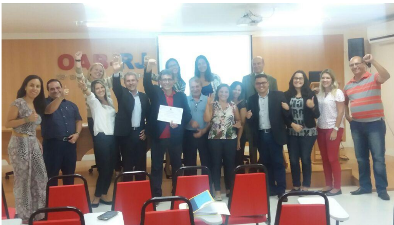
Cápsulas do Direito – Direito Imobiliário